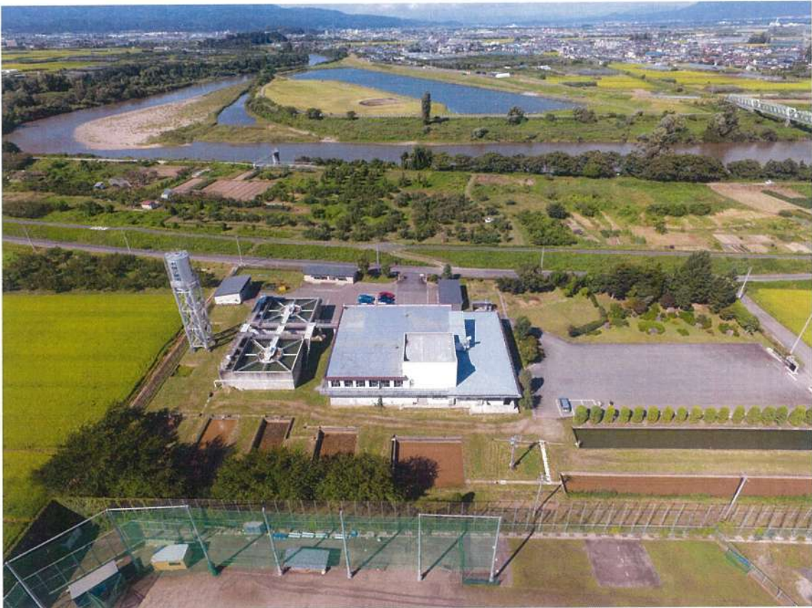
企業団事務所及び最上川（空撮）